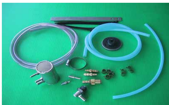
KIT写真 FD3S RX-7用